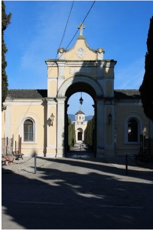
RIGA 1 (Indizio: vi sono seppelliti i defunti)