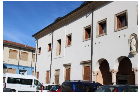
RIGA 5 (Indizio: ci facciamo ACR ogni sabato)