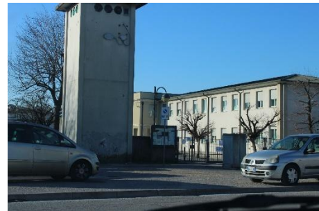
RIGA 7 (Indizio: ci vai per studiare, PLURALE)