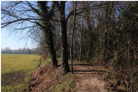
RIGA 3 (Indizio: è il fiume che passa per Sandrigo)