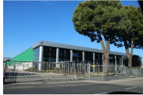
RIGA 6 (Indizio: è la zona in cui ci sono tante fabbriche)