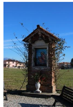
RIGA 8 (Indizio: è un simbolo religioso)