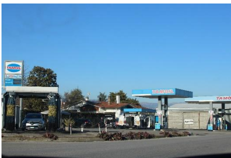
RIGA 4 (Indizio: ci vai per fare "rifornimento" alla macchina)